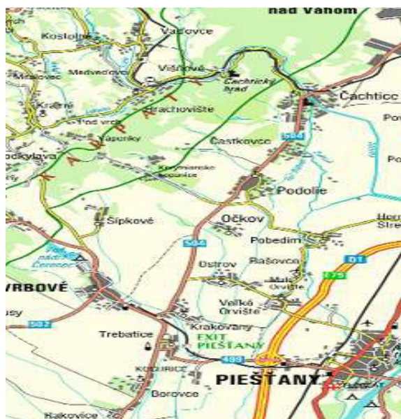
Geografická poloha obce